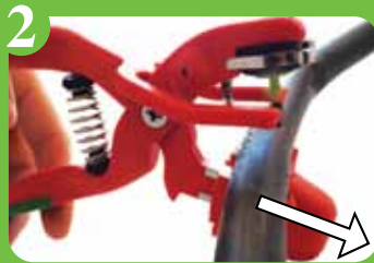
2 Réalignement automatique