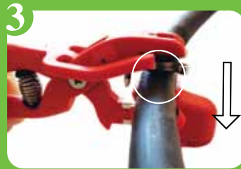
3 Insertion du goutteur